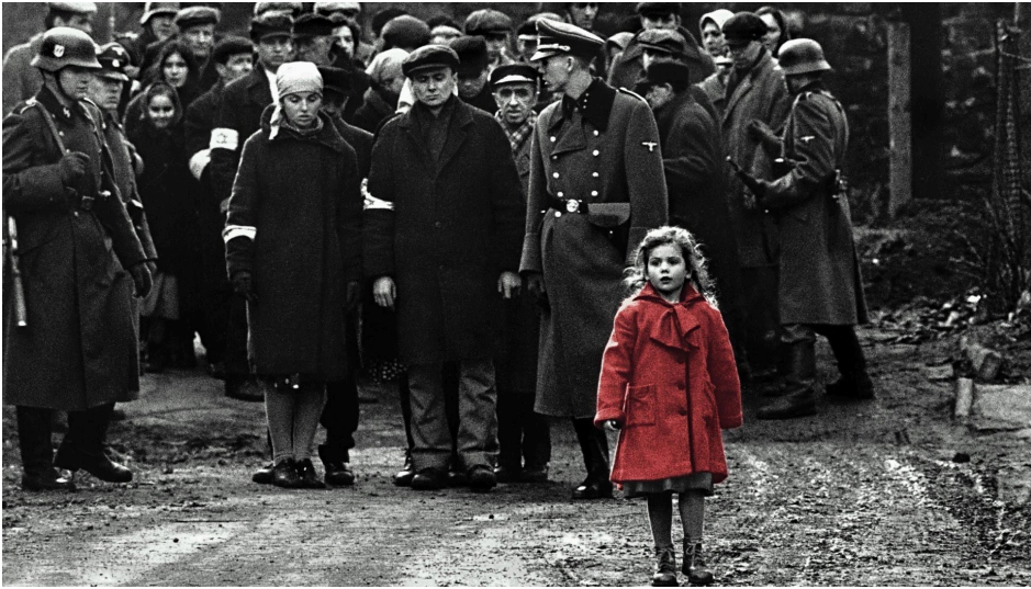
cô bé mặc áo khoác đỏ. - La Liste de Schindler

Spielberg giải thích sự lựa chọn của mình như sau: