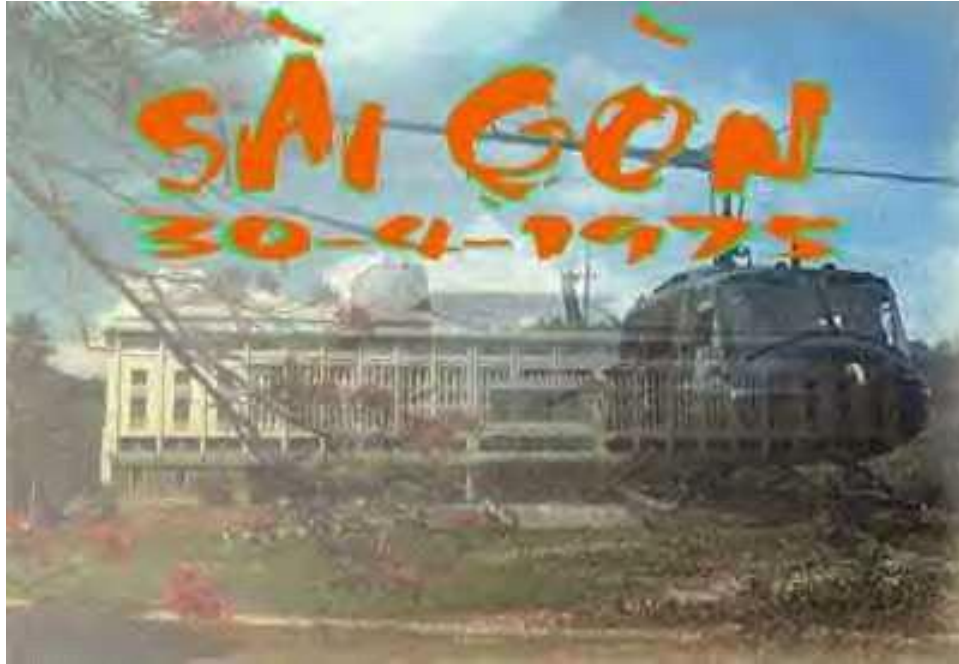
Mất Sài Gòn (30/04/1975)

Thấm thoát đã 48 năm kỷ niệm ngày mất nước, người Việt lưu vong khắp nơi trên thế giới, người còn người mất. Thế hệ thứ nhất mơ ước ngày về khi đất nước thật sự có Tự Do, Dân Chủ và Nhân Quyền chưa thấy đâu thì đã nằm im dưới huyết lạnh. Thế hệ thứ nhất kỳ vọng con cháu của mình vào dòng chánh ở xứ người, làm nở mày nở mặt tổ tiên, ông bà của mình và mong con cháu của mình vẫn nhớ mình là người Việt Nam, tranh đấu cho một Việt Nam thật sự có Tự Do, Dân Chủ và Nhân Quyền.