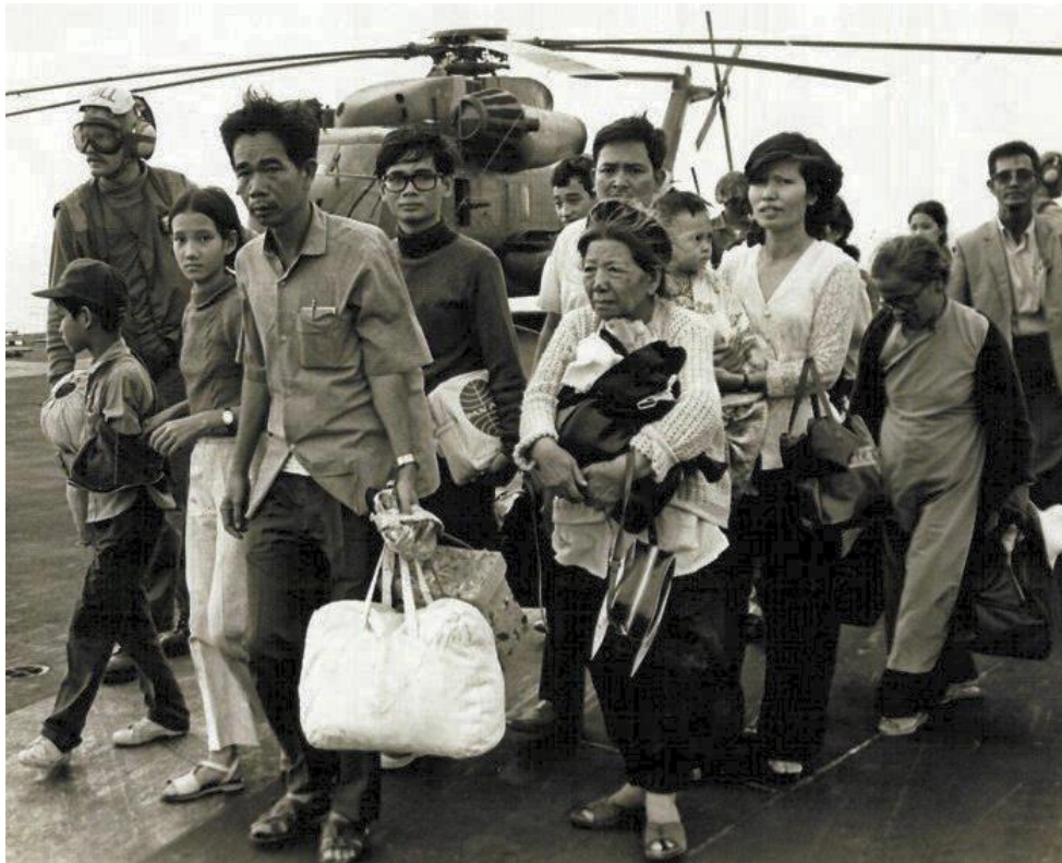
Tháng 4 Đen, hàng ngàn người Việt Nam di tản khắp nơi trên thế giới.

Đến ngày 30 tháng 4 năm 2023 là 48 năm ngày mất nước, ngày mà người dân bỏ nước đi tìm Tự Do, ngày mà hàng ngàn quân nhân, công cán chính bị tù đầy, vợ mất chồng, cha mẹ mất con, người chết trên mặt biển, người chết trên rừng sâu núi thẳm, ngày đau thương nhất của người dân Việt Nam. Mỗi năm đến ngày này hàng triệu người cầu nguyện cho vong linh các chiến sĩ, bỏ mình vì Tổ Quốc, ngày mà người dân Việt ở khắp nơi trên thế giới cầu nguyện ở chùa, nhà thờ, những nơi tôn nghiêm cho người dân Việt chết oan, chết ức ở khắp nơi được siêu thoát và cầu nguyện cho người thân của mình ở quê nhà thật sự có Tự Do, Dân Chủ, Nhân Quyền và bảo toàn lãnh thổ, lãnh hải.