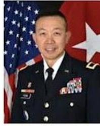
Th. T. Lapthe C. Flora Vệ Binh Quốc Gia (1962-20xx)