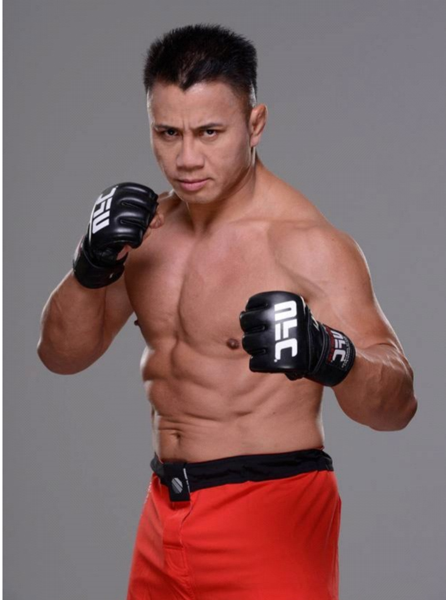
Cung Lê- cựu võ sĩ UFC

Bất cứ người nào làm việc gì quyết tâm để hết tâm trí vào việc làm nhất định phải thành công. Làm việc dành dụm, đầu tư nhất định phải thành triệu phú. Có người suốt đời không bao giờ đi ăn tiệm, không đi mua sắm, không đi phố, không mua hàng rẻ, khi nào cần thứ gì thì đi mua thứ đó, không bị quyến rũ bởi hàng rẻ, không đi xe đẹp, không mua bóp đắt tiền, đọc sách thì vào thư viện sách gì cũng có, sách cũ, sách mới in cũng có, sách đủ loại, thư viện mở cửa rất muộn, vào thư viện đọc sách, không cần phải mua sách nhiều.