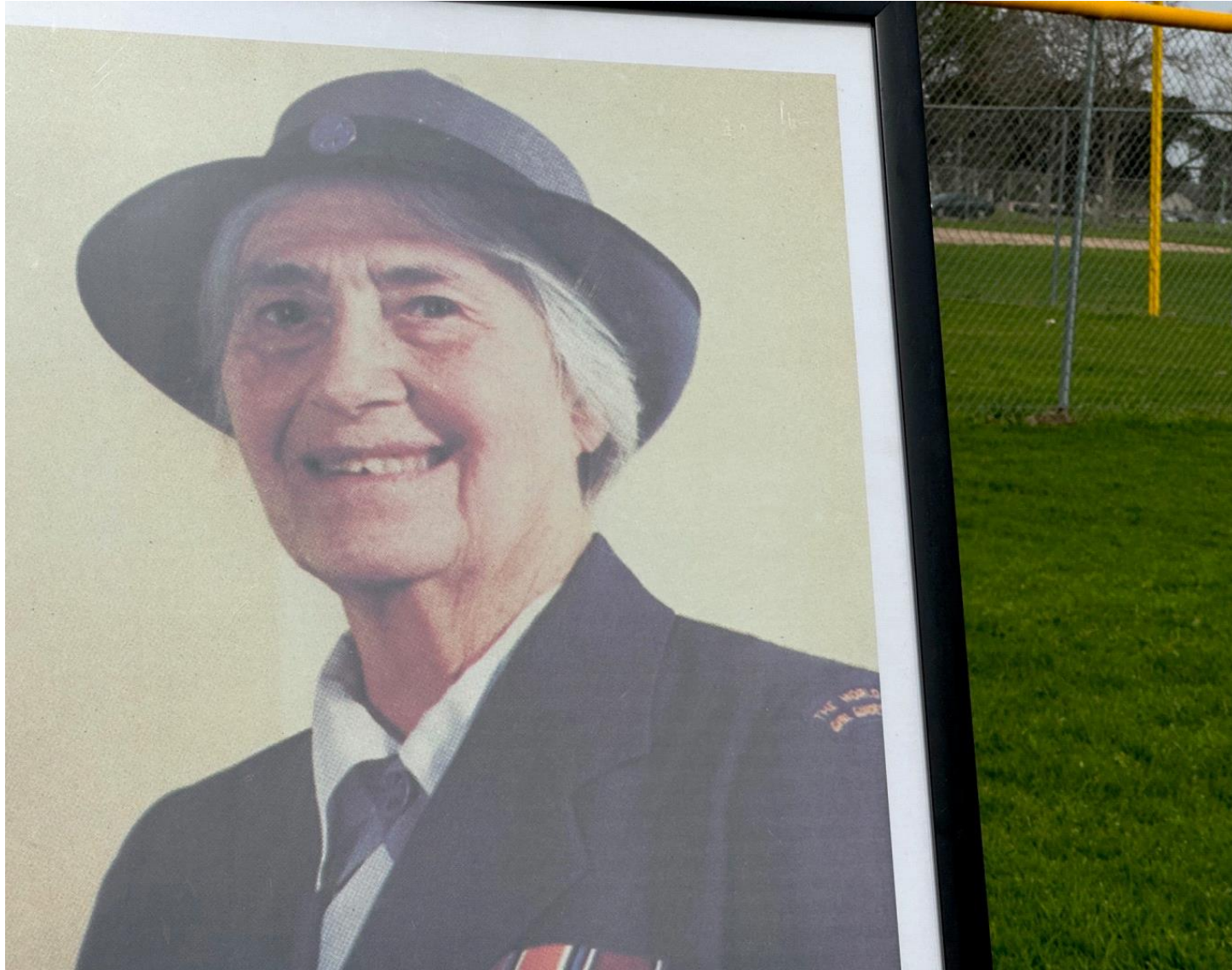
Bà Olave St Clair Baden-Powell, phu nhân của Huân tước Baden Powell.