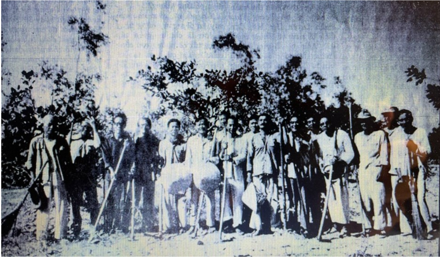
Đội 23- các tướng tá (Ảnh chụp 1990- do tác giả cung cấp)

Hồi ký "Người muôn năm cũ" của nhà văn Phạm Gia Đại dày trên 500 trang gồm có 17 chương, mỗi chương với vẻ riêng, đặc sắc của từng chương. Cuốn sách đưa chúng ta trở về những năm tháng tươi đẹp đầy kỷ niệm thương yêu của Sài Gòn, của miền Nam và những ký ức đau buồn sau ngày mất miền Nam, và những năm tháng sống trở lại với cuộc đời mới trên miền đất tạm dung. Nhiều chương tôi đọc vài dòng, nước mắt tôi đã rơi vì người thật, việc thật. Nhiều tác phẩm của các nhà văn nổi tiếng trên thế giới lấy nước mắt của độc giả cũng vì họ viết với trái tim chân thật của họ, nhà văn Phạm Gia Đại cũng vậy, ở tù 17 năm, vẫn còn sinh tiền, vẫn còn thờ để viết những nỗi khốn khổ nhất trên trần gian để chúng ta đọc. Nhà văn Phạm Gia Đại là một người sống hết lòng vì Tổ Quốc, có niềm tin tôn giáo mãnh liệt, yêu thương mẹ và tha nhân, ông biết ơn cuộc đời, biết ơn mọi người.