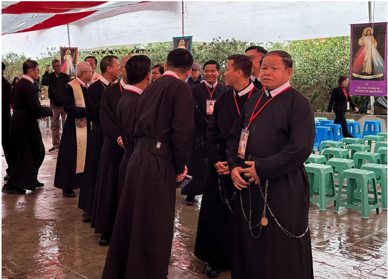
Các linh mục từ khắp nơi về tham dự đại hội Suy Tôn Lòng Chúa Thương Xót lần thứ 26.