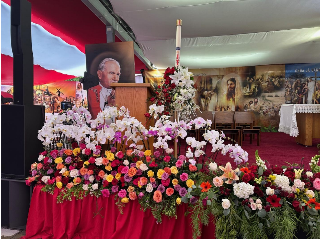
Sân khấu được trang hoàng rực rỡ.

Sân khấu rất đẹp, hoa rực rỡ, lều dựng sẵn từ ngày hôm trước. Những hàng ghế đầu dành cho người tàn tật, đi xe lăn, chống gậy. Ban tiếp tân và trật tự được huấn luyện một cách chu đáo. Khách tham dự vừa bước xuống xe thì có anh em trong ban trật tự che dù cho từng người, đỡ xuống xe giúp người tàn tật. Những người làm việc thiện nguyện với nụ cười thật tươi với tấm lòng bác ái. Người già tóc bạc phơ, người trẻ ăn mặc rất đẹp, phụ nữ mặc áo dài rực rỡ. Ca đoàn, phụ nữ mặc áo dài màu đỏ tha thướt.