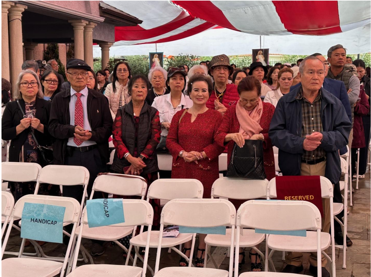
Đồng hương dự lễ sốt sáng.

Những linh mục trẻ nói tiếng Việt thông thạo mặc dù họ sinh ra lớn lên ở đây. Không có sự cách biệt giữa người già và người trẻ ở nhà thờ này. Lợi thế của các nhà thờ ở những nơi có đông người Việt là có lớp học tiếng Việt, có tổ chức hội đoàn, cộng đoàn, sinh hoạt hàng tuần nói tiếng Việt đó là phước đức của người tị nạn vẫn giữ được văn hóa Việt Nam.