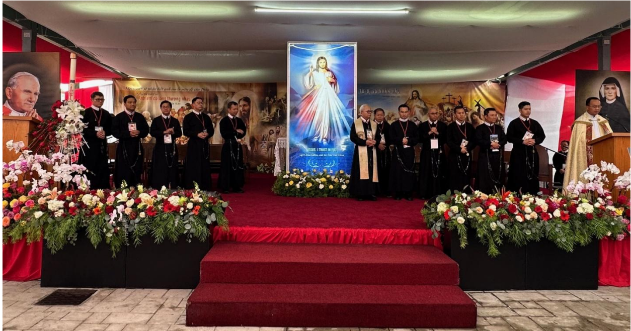
Các linh mục được mời lên sân khấu, chuẩn bị khai mạc đại hội.