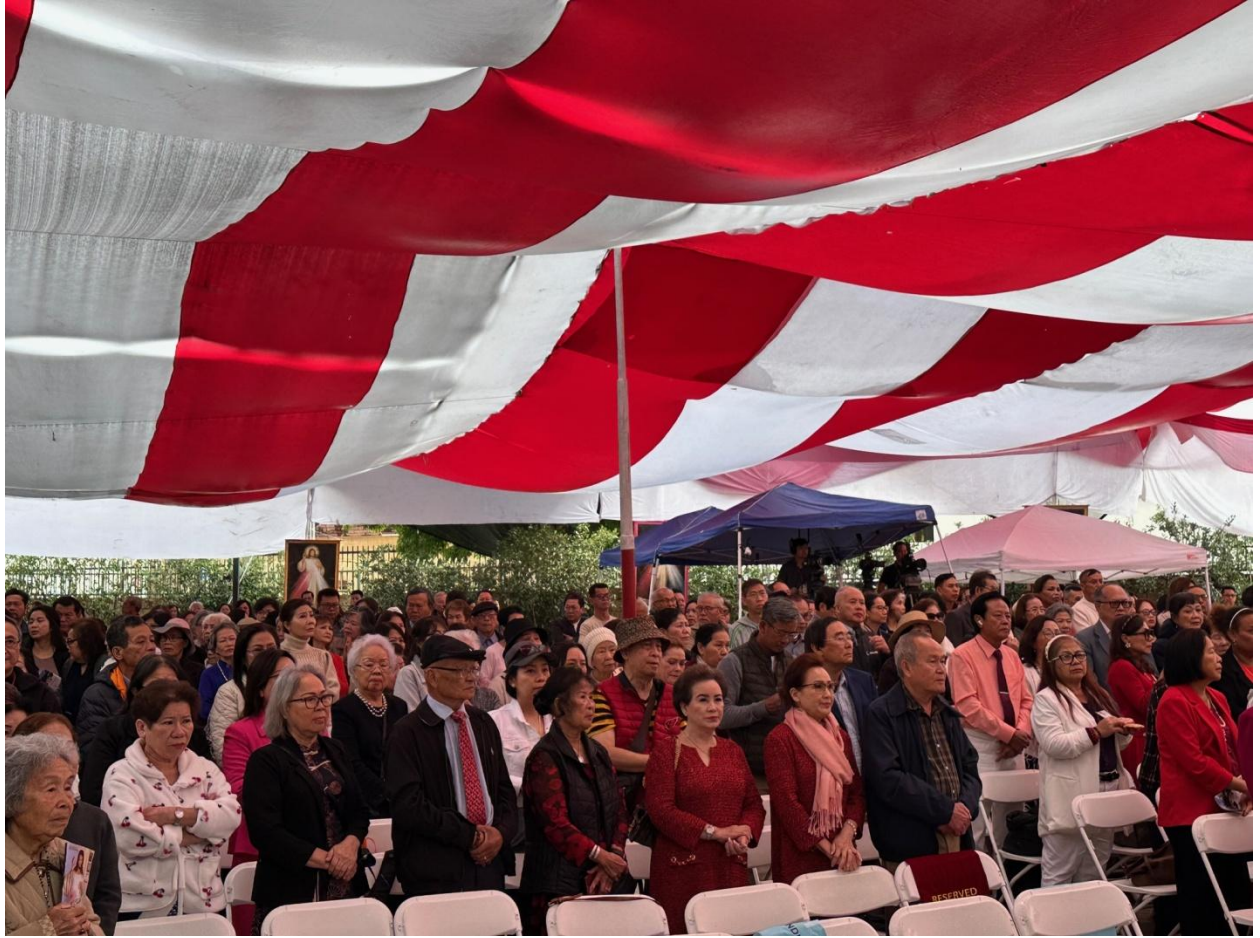
Đồng đạo giáo dân tham dự dưới trời mưa, gió lạnh.

Trời mưa, gió lạnh, đồng hương tham dự đại hội Suy Tôn Lòng Chúa Thương Xót vẫn ngồi từ đầu đến cuối chương trình. Trong nhà thờ không còn một chỗ ngồi, ngoài lều vẫn đông người. Cảm động nhất là những đồng hương lớn tuổi, tàn tật, đi xe lăn, chống gậy, vẫn ngồi yên lặng lắng nghe từng lời giảng của các linh mục một cách thành kính.