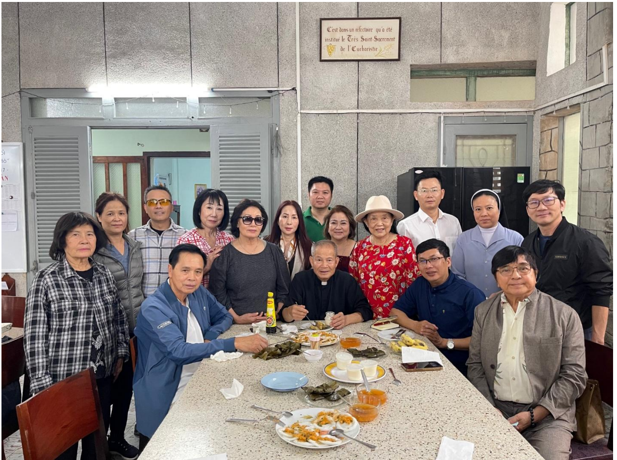
Phái đoàn Hội Bạn Người Cùi thăm người cùi ở Việt Nam ở Quy Hòa, Quy Nhơn cuối tháng 11/2024