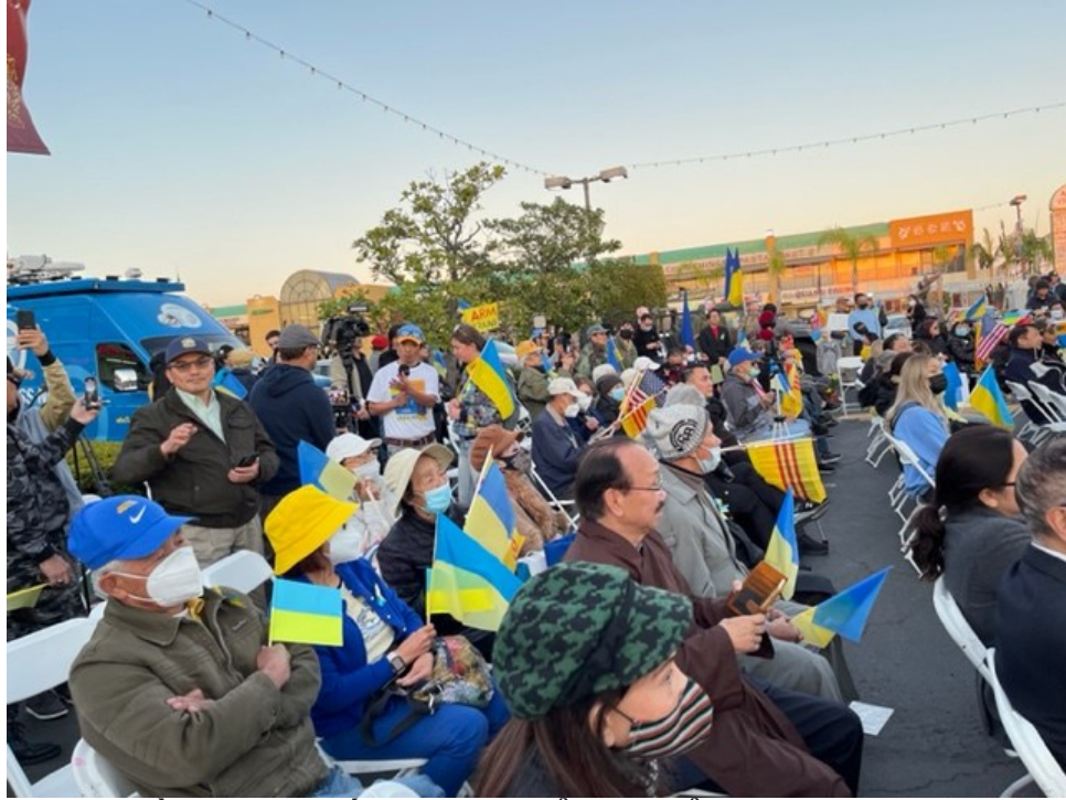
Đông đảo đồng hương đến tham dự biểu tình yểm trợ người dân Ukraine.