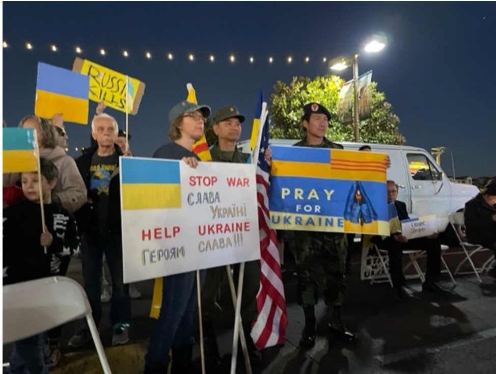
Đông đảo đồng hương đến tham dự biểu tình yểm trợ người dân Ukraine.