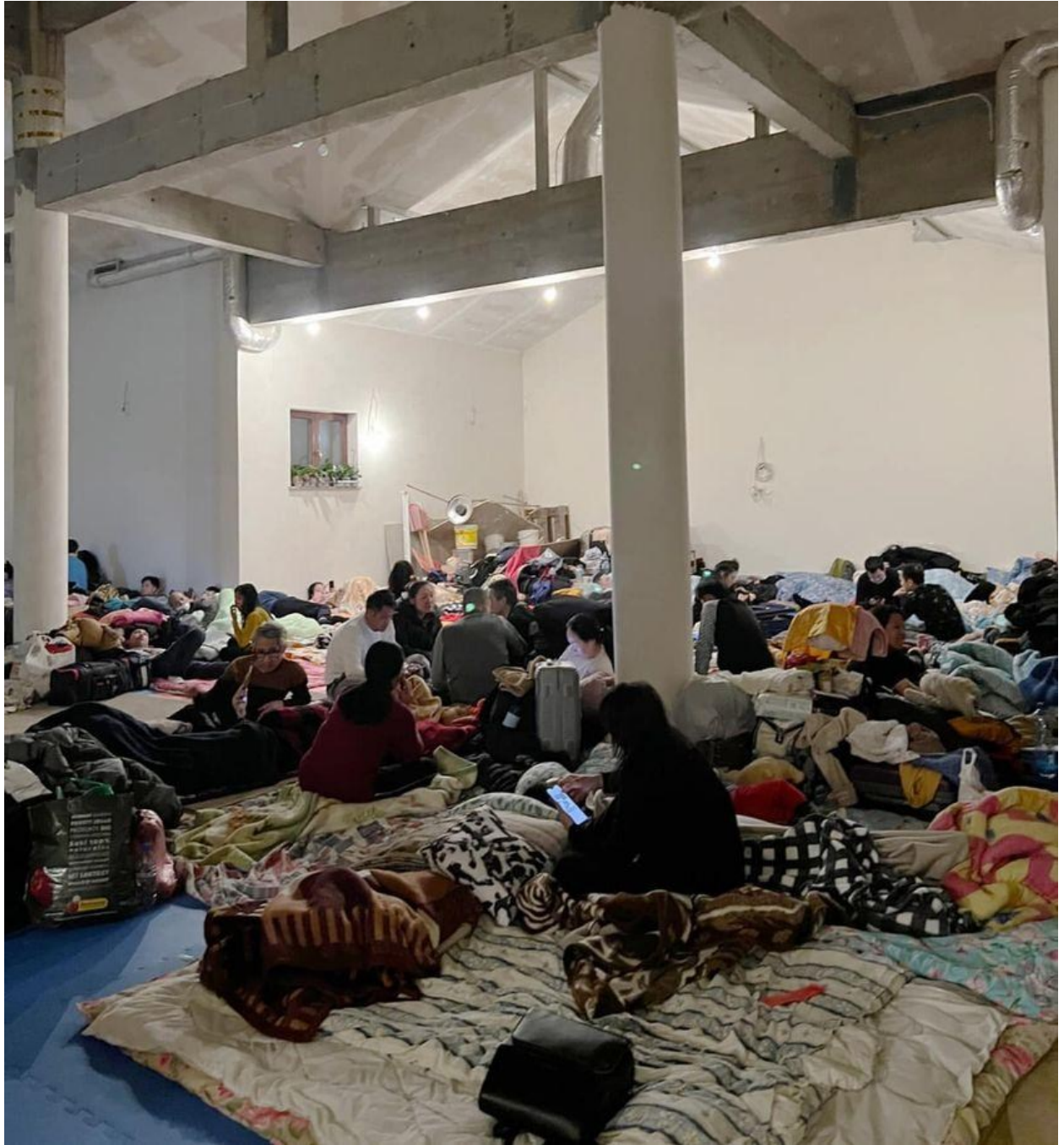
Hình ảnh người Việt Nam đang lánh nạn trong ngôi chùa Nhân Hòa (Ba Lan)