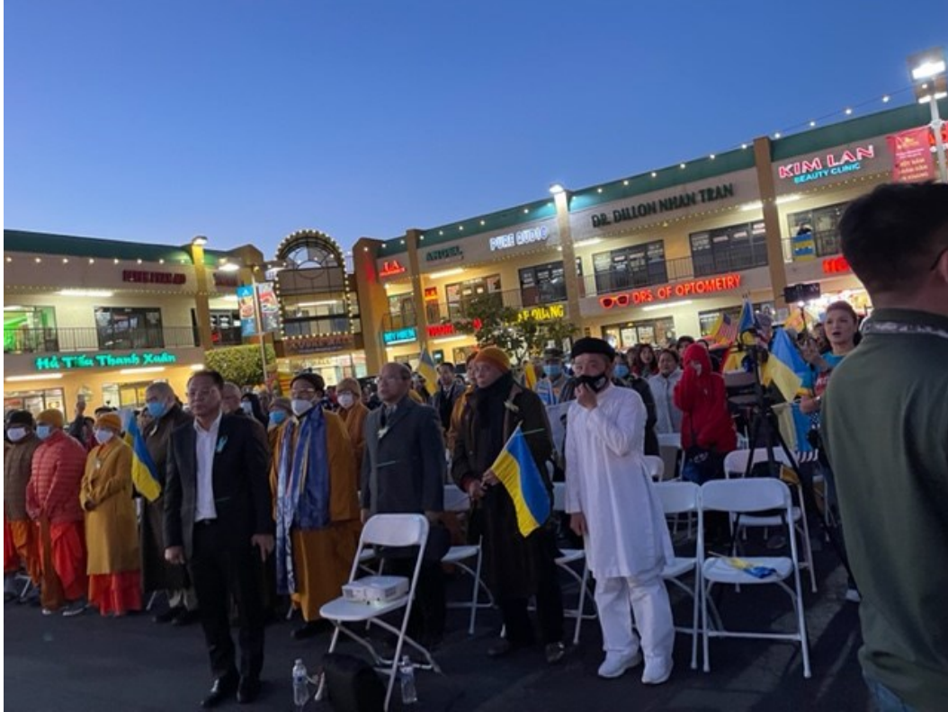
Hội đồng liên tôn, ban tổ chức, đồng hương tham dự biểu tình yểm trợ Ukraine.