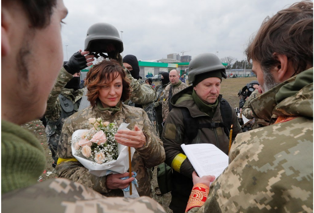
Mặt trận Kyev Ukraine: Đám cưới trên chiến trường

Hình ảnh chiến tranh thê thảm, tàn khốc, chết chóc, máu đổ thịt rơi. Cầu xin Ukraine chiến đấu thành công. Nếu Ukraine mất thì Ba Lan và các nước lân cận sẽ tiếp tục bị xâm lăng.