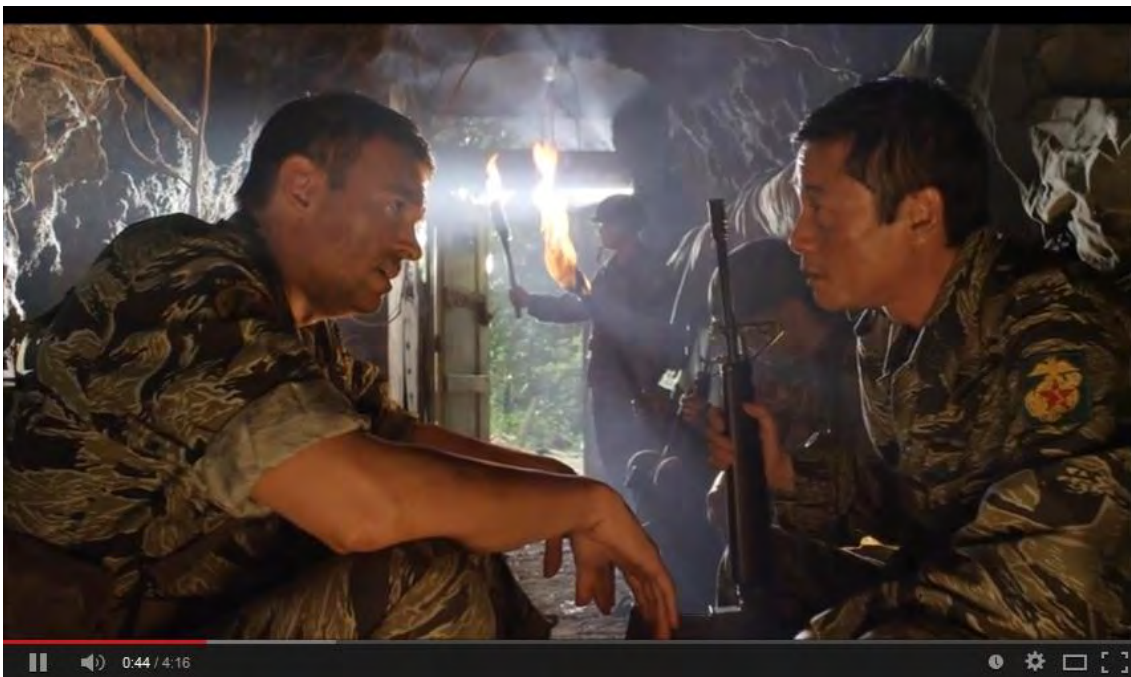
Pictures from the movie in-the-making "Ride The Thunder" by KosterFilms